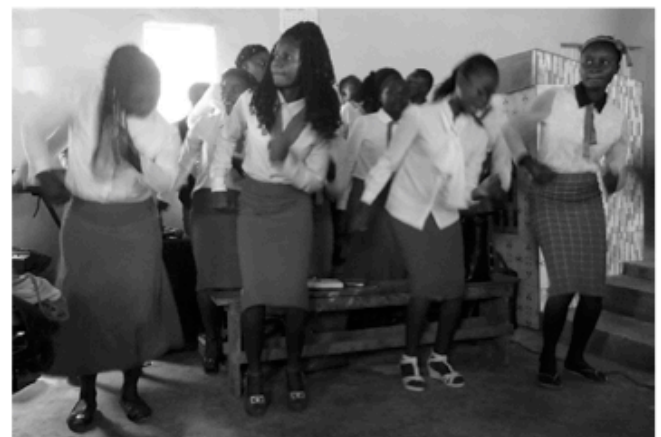
Die Chöre sind immer in Bewegung

In Kolwezi war uns die evangelische Gemeinde dankbar, endlich ein Dach über dem Kopf zu haben: Mit Unterstützung der Partnergemeinden in