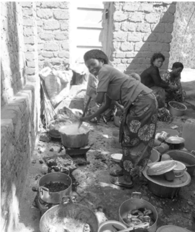
Kochen im Freien - mit Holzkohle

Kirchen sind der einzige Versammlungsraum in den Gemeinden. Man trifft sich hier nicht nur zum Gottesdienst, auch die Treffen der Männer-, Frauen-, Jugendgruppen und die Proben der Chöre finden in der Kirche statt.