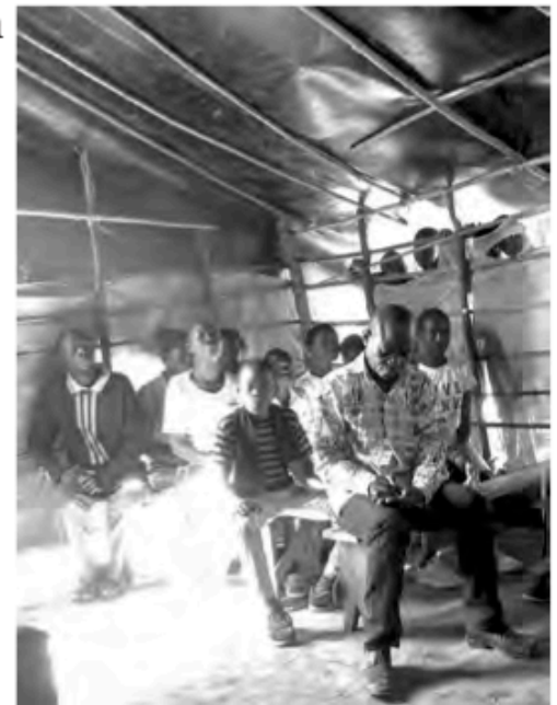
Gottesdienst in einer Zeltkirche

Stunden - und waren zu keiner Zeit langweilig. In der Regel waren mehrere Chöre beteiligt und