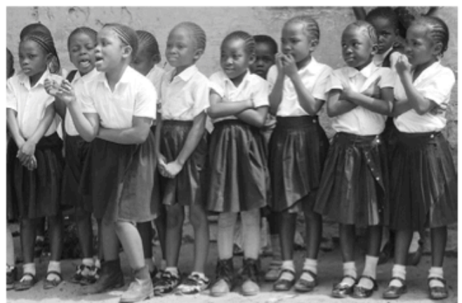
Die Schulkinder in Kolwesi warten gespannt auf unseren Besuch.

Der größte Teil der Kongolesen hat nichts vom Rohstoff-Reichtum ihres Landes. Nur die Hälfte der kon-