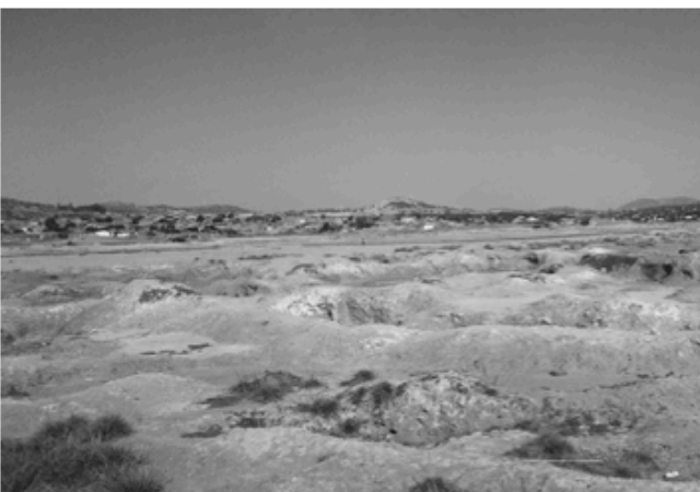
Wenn die Bergbaufirma geht, bleibt eine Mondlandschaft zurück.

Zurück bleibt eine zerstörte Landschaft, die nicht rekultiviert wird