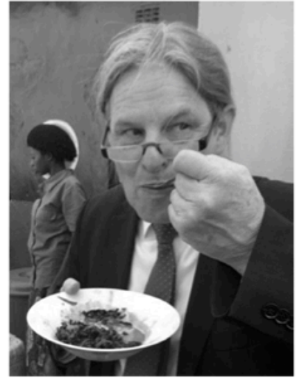
Raupen mit Tomatensoße

90 Prozent der kongolesischen Haushalte kochen mit Holzkohle,