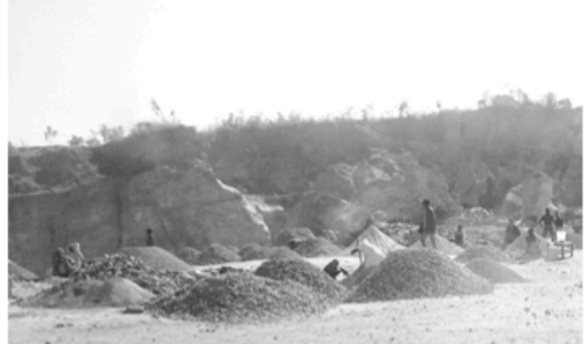
Am Rand der Minenfelder graben Kongolesen in ungesicherten Gruben nach Erzen mit Kupfer und Kobalt.

und vergiftete Flüsse, in denen der Fischbestand gefährdet ist. 60 Prozent der weltweiten Kobaltproduktion kommen aus dem Kongo, benötigt werden sie für die Batterieherstellung. „Elektromobilität ist weltweit der Schlüssel zu klimafreundlicher Mobilität.“ - schreibt das Bundesministerium