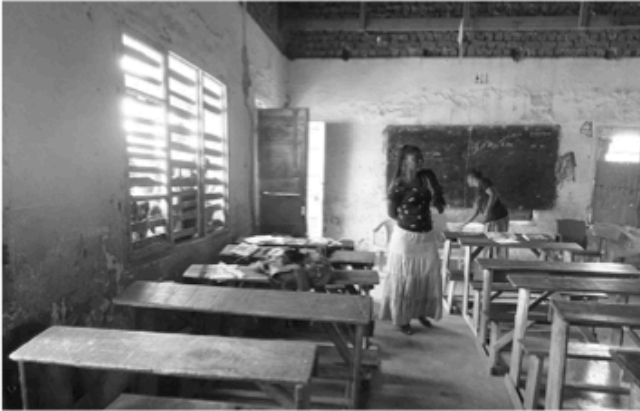
Ein Klassenzimmer in der Schule "Epiphanie III" in Kolwezi

golesischen Kinder kann sich einen Schulbesuch leisten. Die kirchlichen Schulen sind in einem desolaten Zustand. Es fehlt an Einrichtungsgegenständen und Unterrichtsmaterial