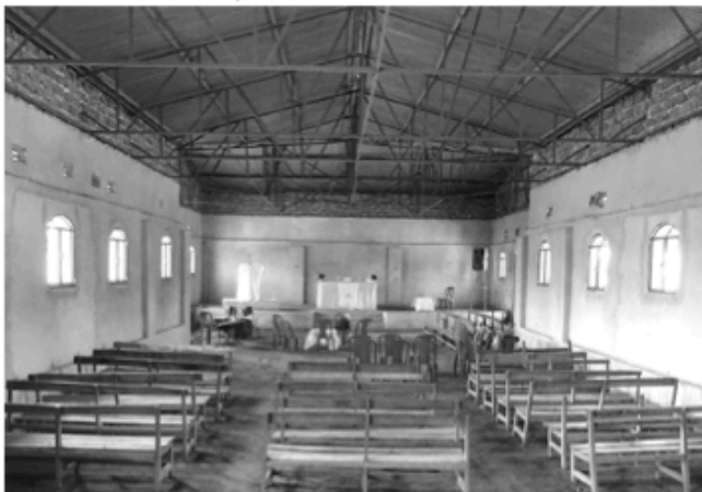
Die Kirche in Kolwezi hat jetzt ein Dach

Die Gottesdienste, die wir in Lubumbashi, Likasi und Kolwezi mitfeiern konnten, dauerten drei bis vier