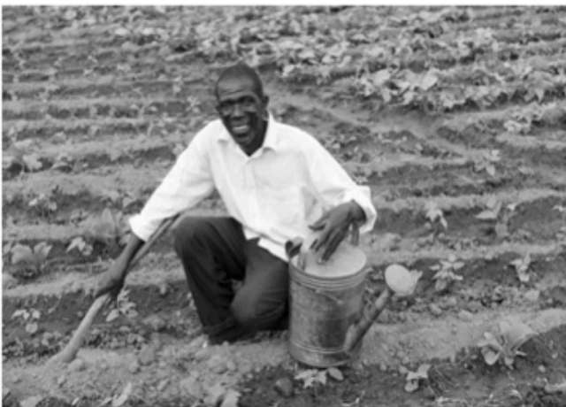
Sichere Ernten trotz Klimawandel

Es bleibt aber noch viel zu tun: Jeder neunte Mensch hungert und hat kein sauberes Trinkwasser. Millionen leben in Armut, werden verfolgt, gedemütigt oder ausgegrenzt. Die einen bauen ihren Wohlstand auf Kosten anderer aus. Das soll und muss nicht sein! Es ist genug für alle da, wenn wir gerecht teilen. In einer Welt, deren Reichtum wächst, darf niemand zurückgelassen werden.