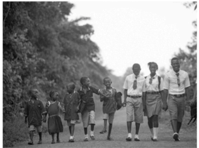
Schule statt Kinderarbeit

jekten dazu bei. Sie fördern Bildung und Gesundheit, den Zugang zu Wasser, Land und Nahrung. Sie kämpfen für soziale Gerechtigkeit, die Rechte der Schwachen und die