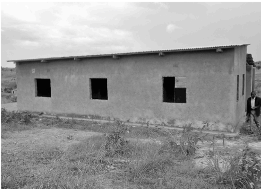
Das Gesundheitszentrum im Rohbau

Die Partnerschaft mit der Evangelisch-Lutherischen Kirche im Kongo ist Thema des Gottesdienstes am 20. Mai 2018. Einmal im Jahr verbindet dieser Gottesdienst die Gemeinden in Nürnberg und im Kongo auf besondere Weise.