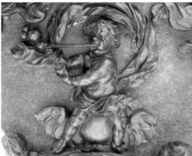
homo bulla - der Mensch ist eine Seifenblase. (Epitaph auf dem Johannesfriedhof)