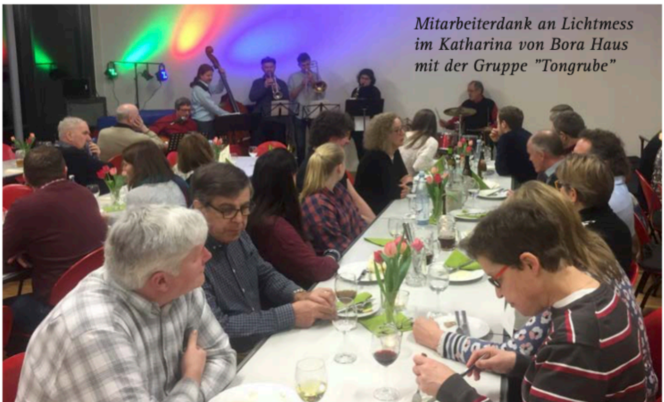
Mitarbeiterdank an Lichtmess im Katharina von Bora Haus mit der Gruppe "Tongrube"