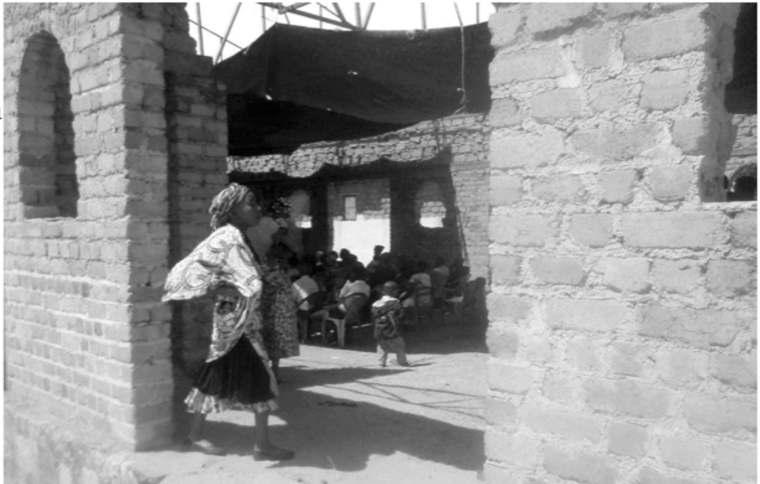
Kirchenbau in Kolwesi: Die Mauern stehen, das Dach ist notdürftig mit Planen abgedeckt. Jetzt soll der vor Jahren begonnene Kirchenbau mit Ihrer Unterstützung fertiggestellt werden.

Die politische Situation im Kongo ist instabil, die wirtschaftliche Lage