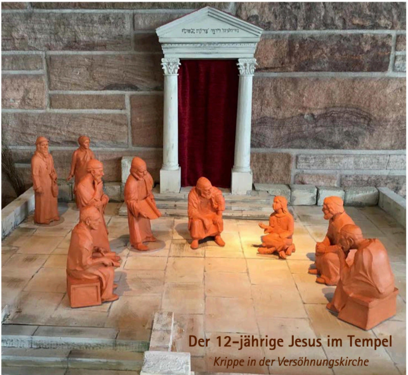
Der 12-jährige Jesus im Tempel Krippe in der Versöhnungskirche

Herzliche Einladung zu den Gottesdiensten in der Advents- und Weihnachtszeit!