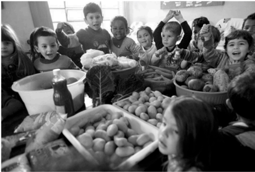
Die Kinder freuen sich über gesunde Ernährung.

Bis 2050 werden drei von vier Menschen in Städten leben. Besonders auf der Südhalbkugel zieht es sie vom Land in die Stadt – in der Hoffnung, dort Arbeit und ein besseres Leben zu finden.