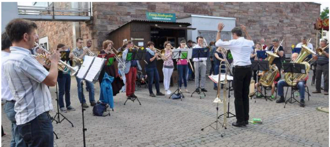
Musikalischer Kirchweihausklang: Das Standkonzert des Posaunenchores