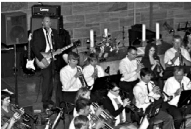
Posaunenchor und Band FEEL FREE bei der Musiknacht 2013

Auch sonst bleibt die Veranstaltung ihrem bewährten Konzept treu: Los geht's ab 20 Uhr, der Eintritt ist frei, für Getränke und einen kleinen Imbiss in der Pause ist gesorgt.