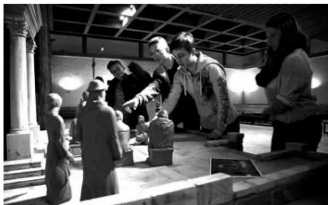
Die Konfirmanden stellen die Krippenfiguren für die Tempelszene auf.

In der Online-Ausgabe des Gemeindegrußes werden keine personenbezogenen Daten von Gemeindemitgliedern veröffentlicht.