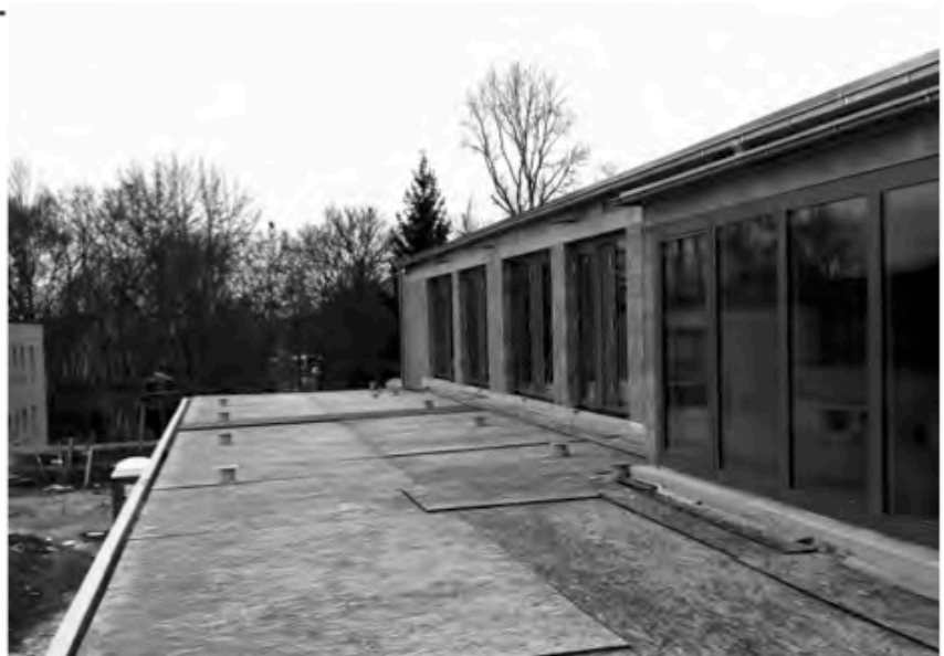
Mehr Platz im Freien: Für die Kinder in Krippe und Hort stehen zusätzlich zu dem Außengelände auch 300 Quadratmeter Spielfläche auf der Terasse zur Verfügung.

in die oberen Räume zu transportieren – er sorgt aber auch dafür, dass das neue Kinderhaus behindertengerecht gebaut ist.