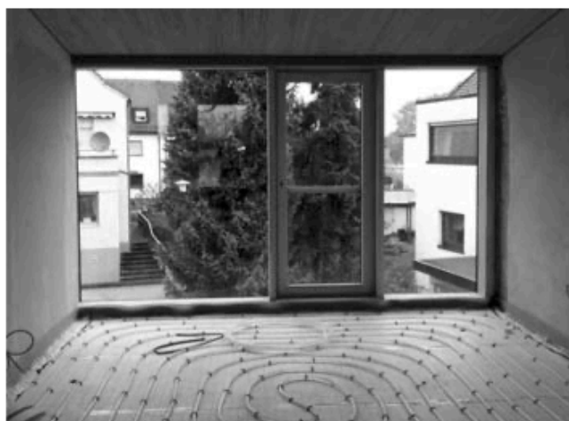
Warme Füße: Das Kinderhaus ist mit einer Fußbodenheizung ausgestattet.

Wer jetzt durch das Kinderhaus geht, der bekommt schon einen guten Eindruck von den großen, hellen und freundlichen Räumen. Die Akustikdecke aus Holz im ersten Stock sorgt für eine besondere Atmosphäre. Die große Glasfassade im Norden bringt Licht in das Kinderhaus und schafft besondere Ausblicke.