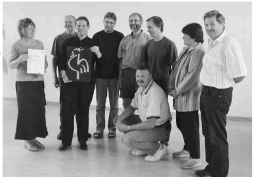
2005 wurde der „Grüne Gockel“ verliehen. Nach 7 Jahren verzichtet die Gemeinde auf die Zertifizierung.

ten. Die Konsequenz ist, dass eine Auszeichnung mit dem „Grünen Gockel“ dann natürlich nicht mehr