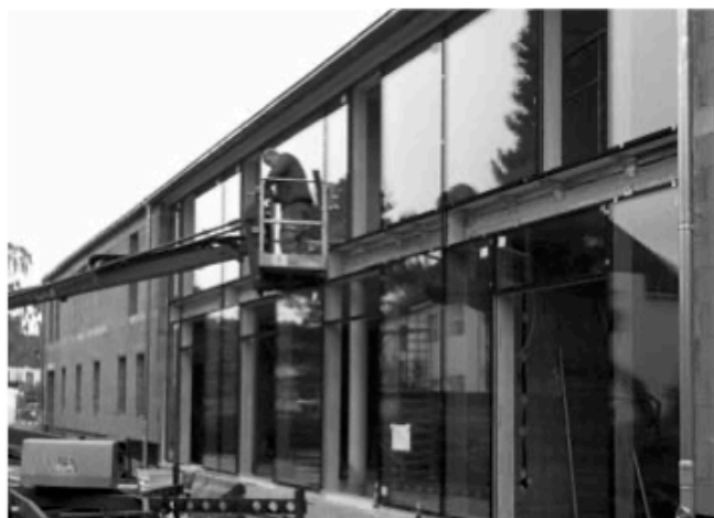
Die Glasfassade an der Nordseite

Im Inneren hat sich eine Menge getan: Kilometerlange Leitungen für Strom, Wasser und Heizung wurden verlegt, die Wände sind verputzt, der Estrich ist verlegt. Im Treppenhaus wurde das Geländer angebracht und die Vorbereitungen für den Einbau des Aufzugs getroffen.