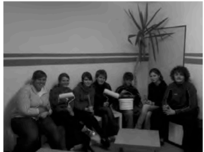
Der neue Jugendraum ist fertig!

bisschen näher kennen und stellten fest: „Die aus der anderen Gemeinde sind doch auch ganz nett...“