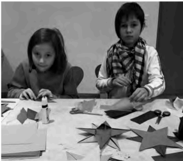
Basteln beim Kinderbibeltag.

Zum Start der Sommerferien fand wie jedes Jahr die Spieleaktion im Stadtteilhaus FiSch statt. Vier Tage lang spielten, bastelten und kochten wir unter dem Motto „Reise zu den Sternen“. Dass alles so gut klappte und wir riesigen Spaß hatten, verdanken wir nicht zuletzt den vielen fleißigen Mitarbeitern.